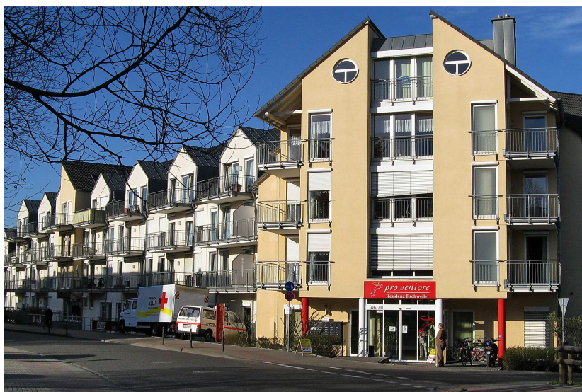
Blutspendetermin in der Pro Seniore Residenz in Eschweiler

Bei den 8 im Jahr 2011 durchgeführten Blutspendeterminen konnten insgesamt 594 Spender begrüßt werden. Dabei konnten 74 Neuspender gewonnen werden. Damit lag die Zahl der Blutspender auf Vorjahresniveau.