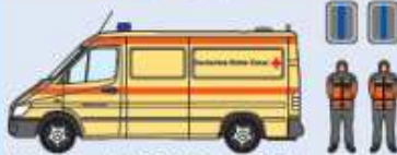
KTW Typ A2 (DRK) AC-RK 3856