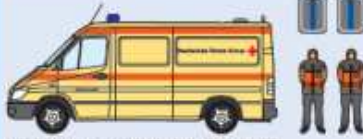
KTW Typ A2 (DRK) AC-RK 3857