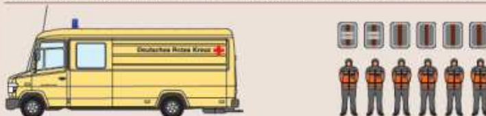
Betreuungs-KFZ (DRK) AC-RK 514

Funk: 03/19/51 Standort: Raiffeisenweg 52249 Eschweiler