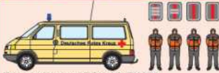
Führungsfahrzeug (DRK) AC-RK 804