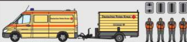
Technik-Kombi (DRK) AC-RK 212 Technik-Anhänger (DRK) AC-VA 373