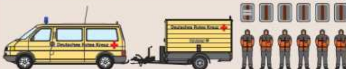
Betreuungs-Kombi (DRK) AC-RK 225 Betreuungs-Anhänger (DRK) AC-VA 373