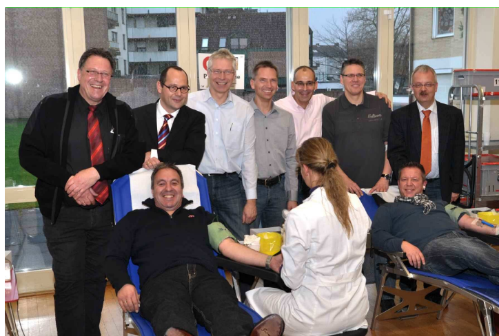
Krankenhaus Eschweiler 21.12.2012