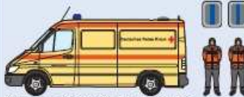
KTW Typ A2 (DRK) AC-RK 3856