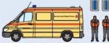
KTW Typ A2 (DRK) AC-RK 3857