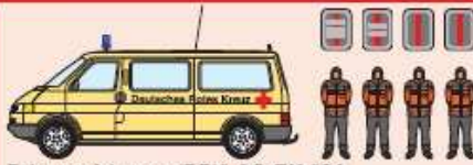
Führungsfahrzeug (DRK) AC-RK 804