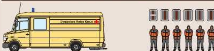
Betreuungs-KFZ (DRK) AC-RK 514