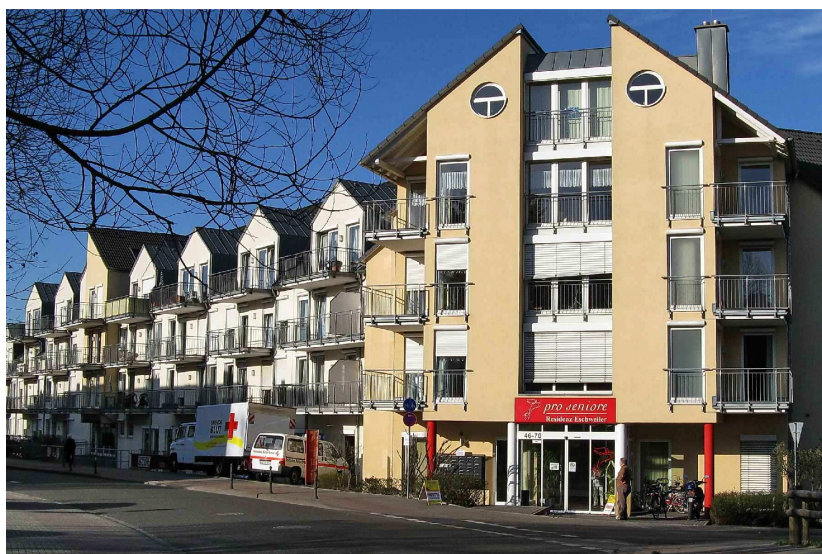
Blutspendetermin in der Pro Seniore Residenz in Eschweiler

Bei den 8 im Jahr 2012 durchgeführten Blutspendeterminen konnten insgesamt 655 Spender begrüßt werden. Dabei wurden 60 Neuspender gewonnen. Damit erhöhte sich die Zahl der Blutspender im Vergleich zum Vorjahr um etwa 10.